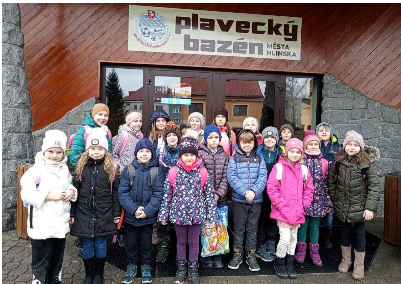
Úspěšně jsme zakončili plavecký výcvik.