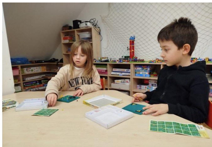
Hrajeme si ve školní družině.

VÝDEJ VĚCÍ: 31. března od 7.30 do 17.00 hodin.