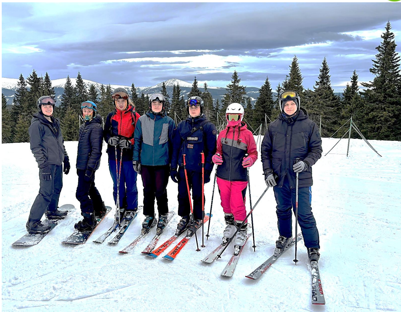
Mládež na lyžařském zájezdě.